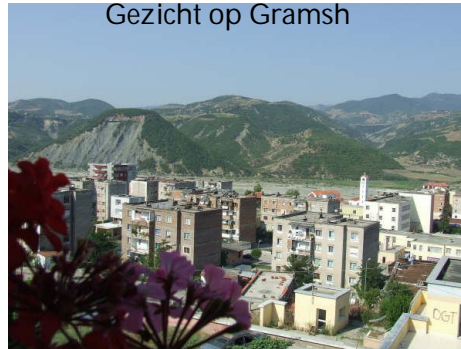
Gezicht op Gramsh